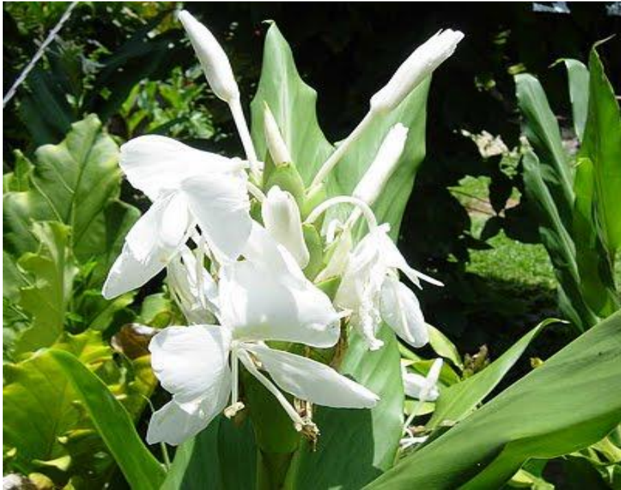
Foto 1. Edycheum coronarium .

Material estudiado 2 : Dpto. Capital: El Aybal, Ruta 51, Km 6-7, casi frente al Aeropuerto, 1300 m s.m. Novara 10570. 5-V-1992.- El Huaico, Ruta 9, 1 km al S de la Universidad, 1200 m s.m. Novara 8787. 10-IV-1989.