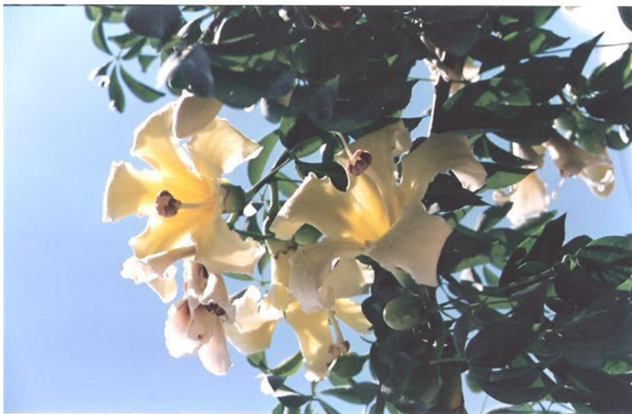
Foto 1. Ceiba chodatii. Rama florífera

Nombres vulgares: "Yuchán", "palo borracho", "p. b. blanco", "p. b. amarillo", "p. b. flor amarilla", "palo botella", "algodón".