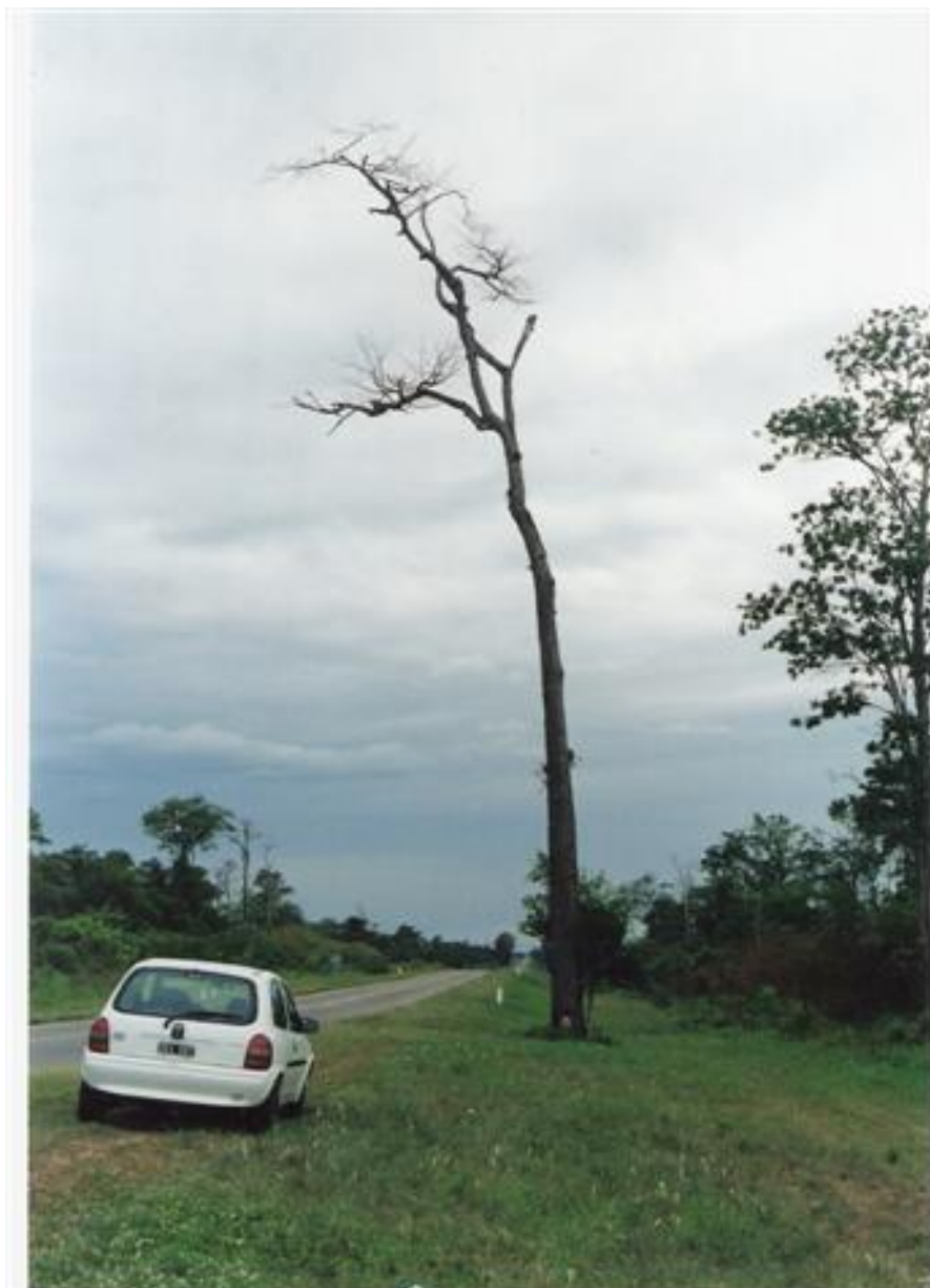
Foto 3. Ceiba chodatii . Dos formas contrastantes de crecimiento. Foto 2, ejemplar típico de laderas y quebradas secas o subhúmedas de la región chaqueña serrana. Foto 3, individuo característico del piso basal de Yungas o de su transición con Chaco Serrano. Tales diferencias se deben más a la competencia por la luz que a las precipitaciones. En el valle de Lerma se encuentran solamente individuos de hábito xerófito.