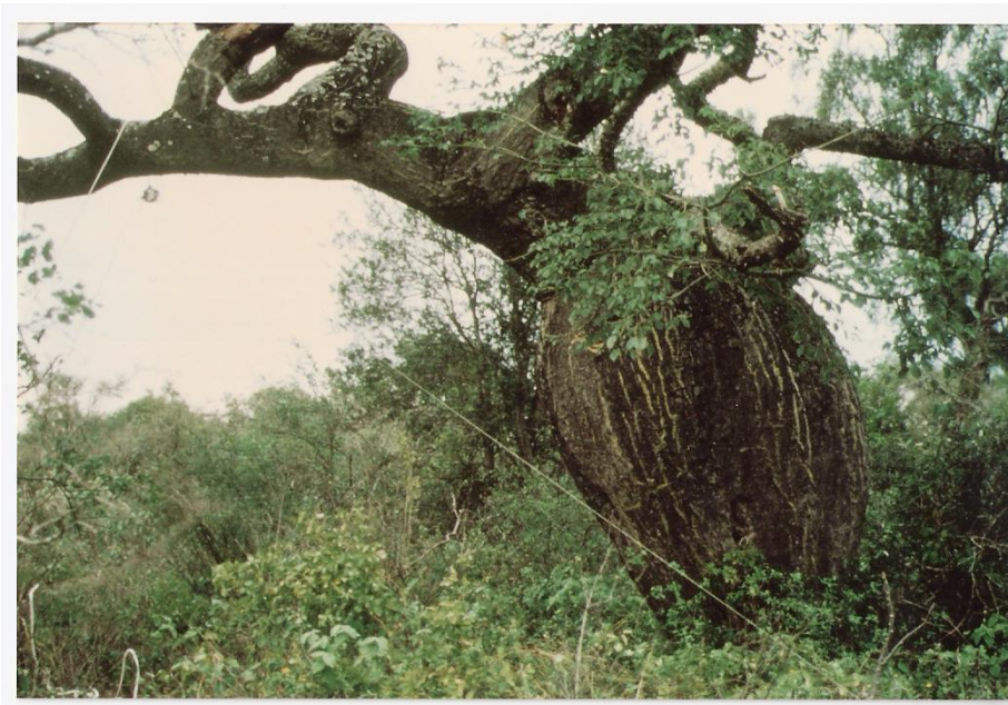
Foto 2. Ceiba chodatii.