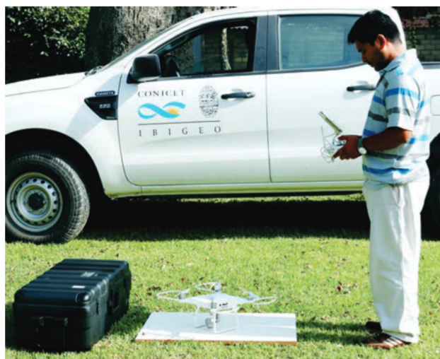
Comprobación de señal GPS y plan de vuelo previo a tareas de relevamiento.

Los drones tienen la posibilidad de incluir una amplia diversidad de sensores como cámaras fotográficas, el LIDAR, cámaras térmicas o multispectrales, etc. Estos sensores permiten la toma de datos de forma rápida y eficaz, esto se traduce en una considerable reducción de tiempo, sobre todo en términos del procesamiento posterior de la información obtenida. Además, los datos pueden ser consultados en tiempo real, permitiendo la corrección o planificación durante la ejecución del vuelo.