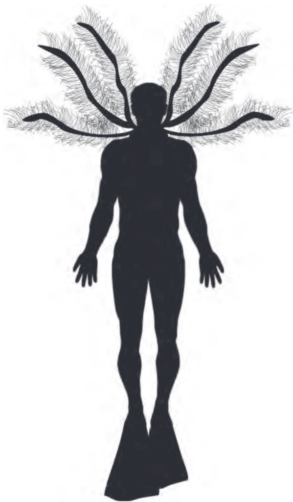
Figura 6. Silueta del prototipo de un humano mutante con branquias externas. Las branquias son fundamentales para la respiración bajo el agua mientras que las “patas de rana” son un componente adicional para la propulsión.

y debería esparcirse en las generaciones posteriores. Sin embargo, la presencia de branquias en seres humanos es inviable ya que, incluso si fuera posible su desarrollo, no sería posible extraer suficiente oxígeno para mantener su metabolismo o deberían ser muy grandes y residir fuera del cuerpo (Fig. 6). Esto último no representaría ninguna ventaja ya que serían muy sensibles a acciones externas. Por otro lado la presencia de membranas interdigitales en humanos (sindactilia) ocurre raramente y generalmente sólo entre dos dedos. De todas maneras, para actuar realmente como un órgano propulsor su tamaño también debería estar acorde con el tamaño del cuerpo humano. De aquí se desprende que el rango de variación no es infinito sino que hay límites (restricciones) dentro de los cuales la variación puede ocurrir. Esos límites se relacionan con lo que el desarrollo tiene grabado en su historia.