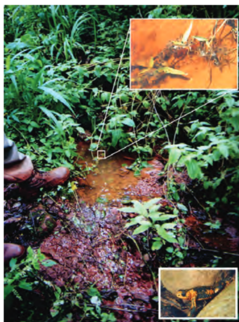
Figura 5. Sitio de cría del sapito panza roja en un ambiente impredecible de Yungas. Los charcos donde la especie deposita sus huevos son de pequeño tamaño y están directamente sujetos a las precipitaciones para mantener un hidroperiodo tal que pueda asegurar la finalización del desarrollo larval y la metamorfosis en esta especie.

Pero... ¿qué pasa si no hay plasticidad? El sapito de panza roja ( Melanophryniscus rubriventris ) es un anuro que se reproduce en charcos pequeños y efímeros de las selvas de montaña del noroeste de Argentina en áreas con fuertes pendientes y suelos muy permeables (Vaira, 2000). En un ambiente tan dinámico, donde las características físicas de los charcos pueden cambiar drásticamente a lo largo de la temporada reproductiva, un charco que era óptimo para reproducirse al inicio de la temporada puede cambiar esta condición de manera muy difícil de predecir (Fig. 5). En este caso, se podría pensar que resulta ventajoso para la especie acelerar o desacelerar su desarrollo a fin de sobrevivir y alcanzar tamaños óptimos para la vida adulta. Sin embargo, esto no ocurre en esta especie y varias ovipositoras y renacuajos en desarrollo aparecen muertos a causa de la desecación (Goldberg, 2003). ¿Esto quiere decir que la especie no está adaptada a este sitio? De ninguna manera, ya que la especie vive allí. Lo que si sucede es que algunas especies pueden flexibilizar su desarrollo mientras que en otras las posibilidades de variar están muy limitadas.