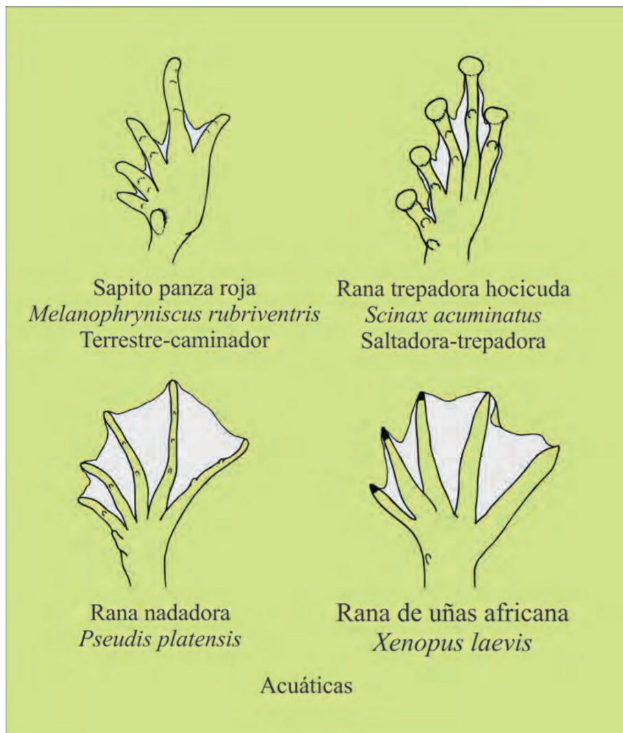
Figura 2. Vista ventral de las patas de cuatro especies de anuros. La presencia de tejido interdigital es común aún en aquellas especies que nos son acuáticas.

siempre se relaciona con especies acuáticas: sucede que todas las especies acuáticas poseen tejido interdigital pero no todas las que poseen tejido interdigital son acuáticas. Así, es importante separar adaptación (en este caso cualquiera diría que es una adaptación al medio acuático) de las características ancestrales del grupo al cual una especie pertenece. Por ejemplo, las extremidades de la rana africana de uñas ( Xenopus laevis ) y la rana paradójica ( Pseudis paradoxa ) acuáticas —dos especies filogenéticamente distantes, una basal y una más derivada, respectivamente, y especializadas para la locomoción acuática— exhiben similitudes morfológicas que son resultado de cambios durante los estados tempranos del desarrollo de las extremidades en comparación con el resto de los anuros (Goldberg y Fabrezi, 2008). Esta variación, de tipo temporal, se evidencia en morfologías de las extremidades posteriores muy parecidas [isometría (misma longitud) de los dedos] que resultan en un similar modo de locomoción. Por lo tanto, algunas partes del cuerpo pueden ser modificadas, no por acción directa de la selección natural o través de la “búsqueda” de una respuesta eficiente para un ambiente dado sino por cambios durante el desarrollo.