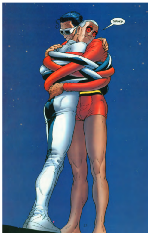
Figura 3. El Hombre Plástico y su hijo Offspring comparten la posibilidad de modificar su cuerpo según las condiciones.

Una predicción general en estudios de anuros que crían y crecen en charcos temporarios de duración impredecible es que sería ventajoso poseer una tasa de desarrollo plástica que se corresponda con las variaciones en el nivel de agua. Se ha demostrado que larvas de numerosas especies que se crían en charcos efímeros han acelerado la metamorfosis en respuesta a la desecación del hábitat exhibiendo lo que se ha denominado plasticidad fenotípica en el tiempo de desarrollo