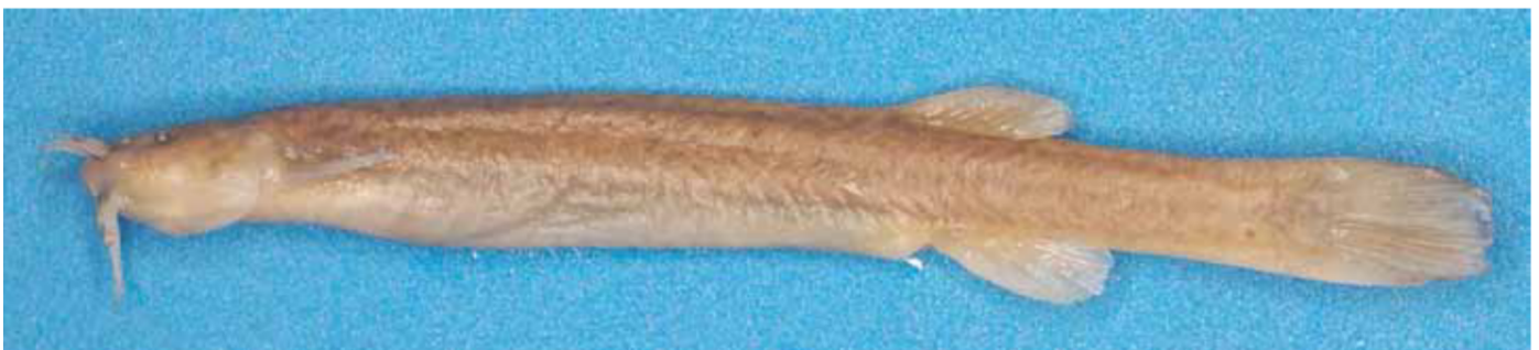
Figura 4: Bagre andino cuyano Silvinichthys leoncitis (MCN 1511 holotipo IBIGEO-Museo Ciencias Naturales Salta) que habita en el Parque Nacional el Leoncito 1.213 m, provincia de San Juan.