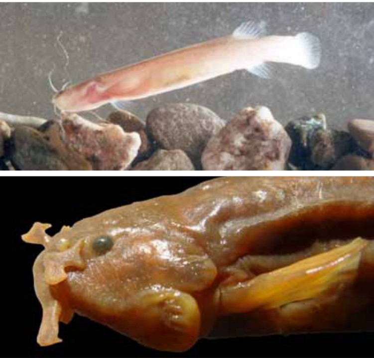
Figura 6: Bagre de montaña endémico de la Cordillera, detalle de la cabeza de Trichomycterus ramosus con las barbillas cortas, anchas y ramificadas dos o más veces, Laguna Blanca, Catamarca.

Algunos autores creen que la gran capacidad para dispersarse ( vagilidad ) de los tricomicteridos se debe a la presencia de los odontoides en los huesos del opérculo e interopérculo (carácter sinapomórfico o condición derivada compartida de la familia Trichomycteridae), que les permite subir contra la corriente anclándose al sustrato o para no ser arrastrados por las crecidas estivales o los deshielos en alta montaña. Y en casos extremos, como los bagres parásitos conocidos como candirú o pez vampiro, también pertenecientes a los tricomicteridos (subfamilias Stegophiliinae y Vandellinae), estas estructuras se modifican como ganchos para ayudar a fijarse a los otros peces mientras se alimentan de la sangre en las branquias ( vandelinos ) o del mucus del cuerpo raspando externamente ( estegofilinos ) (Fernández 2010).