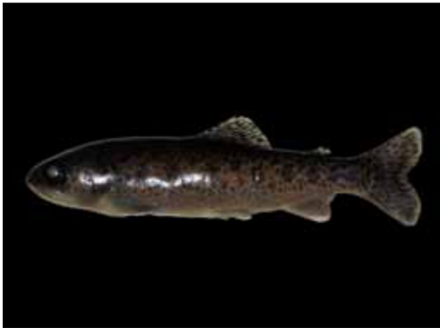
Figura 2: Trucha arco iris Onchorhynchus mykiss obtenida del Parque Nacional el Leoncito, provincia de San Juan.