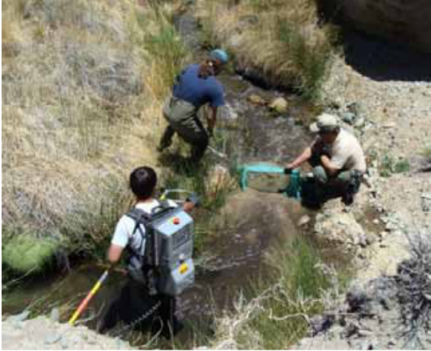
Figura 11: Erradicación de la trucha arco iris en el Parque Nacional Leoncito, San Juan, donde habita Silvinichthys leoncitensis endémica de la Cordillera.

están tomando algunas medidas, como la erradicación de las truchas arco iris (Figura 11) con pesca eléctrica en el Parque Nacional Leoncito en San Juan, donde vive un bagre endémico ( Silvinichthys leoncitensis Figura 4). Pero en las provincias del NOA continúan las políticas de siembra y resiembra en arroyos de cordillera e incluso con mayor difusión de las medidas de protección (Figura 12). Ante la propagación de las truchas, a los bagres nativos de los Andes no le queda otra opción que subir y restringirse en el refugio de las vegas o nacientes de los ríos donde la profundidad del agua es un limitante para la competencia/predación de las truchas (Figura 13).