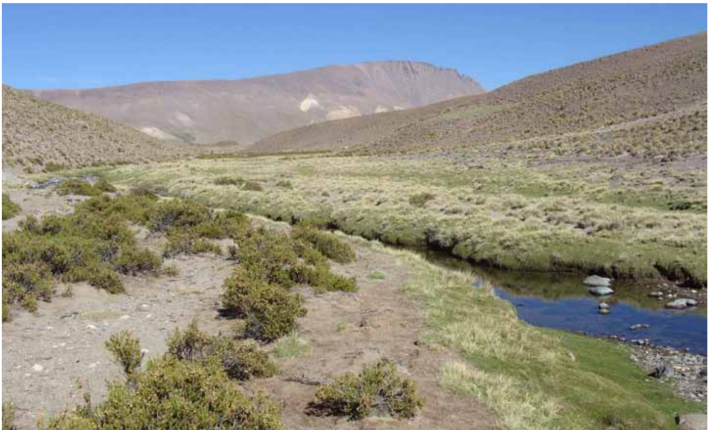
Figura 13: Río donde habita el bagre de montaña más alto registrado para Argentina, Trichomycterus roigi , provincia de Jujuy 4.800 m.s.n.m.