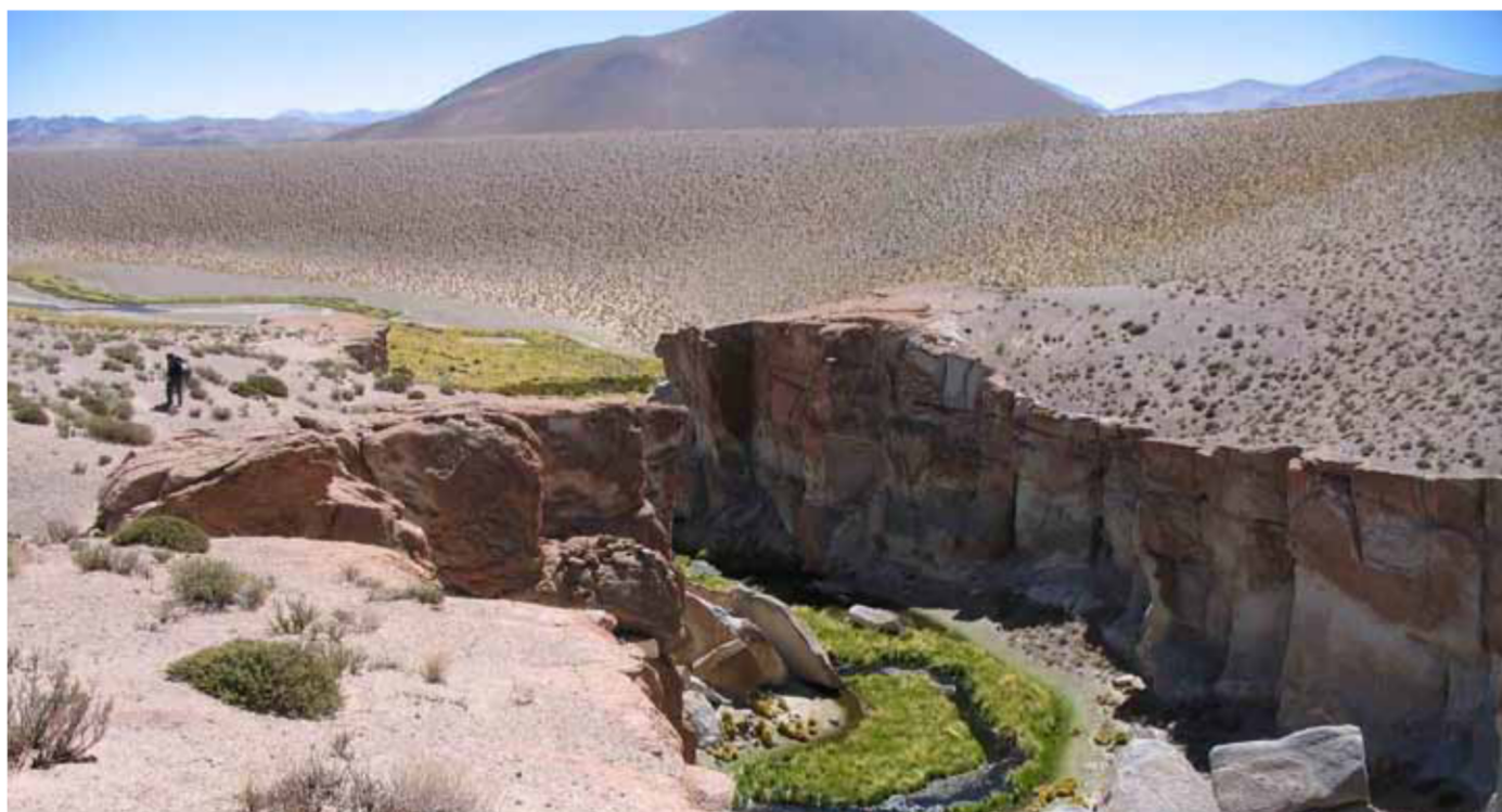
Figura 1: Arroyo del Salar Hombre Muerto a 4.020 m.s.n.m, provincia de Catamarca donde actualmente solo se encuentran las truchas arco iris exóticas.

Por lo general los peces son excluidos de las listas de biodiversidad de vertebrados andinos, presumiblemente porque son menos diversos en altitudes elevadas y a causa del difícil acceso a los lugares de muestreos, donde muchas veces no hay caminos (Figura 1), lo que lleva al escaso conocimiento que se tiene de ellos. Tampoco es raro que los ríos puedan encontrarse secos o bien habitados por las exóticas truchas arco iris (Salmoniformes: Onchorhynchus mykiss Figura 2). En ambos casos será necesario llegar a las nacientes de los arroyos usualmente por arriba de los 2.000 m elevación para verificar su existencia.