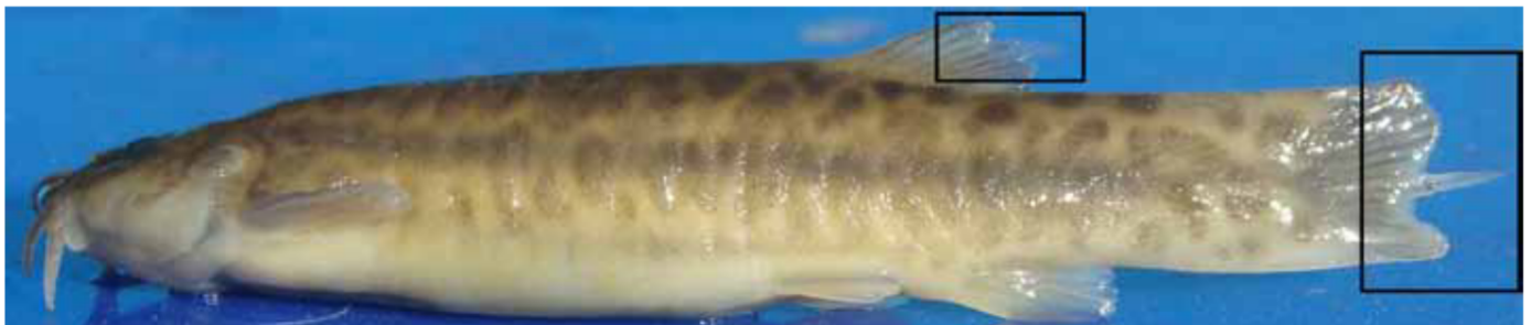
Figura 9: Trichomycterus sp. de un arroyo de la cordillera con la aleta caudal mutilada por la trucha arco iris.

La introducción de la trucha arco iris (Figura 2) en la cordillera (1904) y especialmente en la Puna (1960) no tiene consecuencias menores, debido a que el impacto registrado a la fauna de macroinvertebrados y bagres nativos, algunas veces endémicos, aún está poco estudiado. La invasión de una especie exótica, una vez establecida, difícilmente podrá erradicarse, a diferencia de un contaminante con una fuente emisora localizada que puede controlarse. Por ejemplo, en un arroyo de cordillera, coexiste una especie de Trichomycterus con las truchas arco iris (conocidas por su voracidad (Fernández en preparación)). Cuando el río comienza a retraerse por la sequía aumentan las concentraciones de peces, lo que sumado al menor número de macroinvertebrados bentónicos, hace que en los ejemplares de Trichomycterus se puedan observar aletas mutiladas (Figura 9). Este es el primer caso registrado de que las truchas se alimentan de las aletas de peces nativos andinos. Los registros anteriores son a partir del contenido estomacal de las truchas, pero difícilmente se puedan observar los restos diminutos de aletas con la consiguiente interpretación errónea que las truchas no depredan sobre peces nativos y por ello antes de promover su erradicación se piensa equivocadamente en una explotación sustentable.