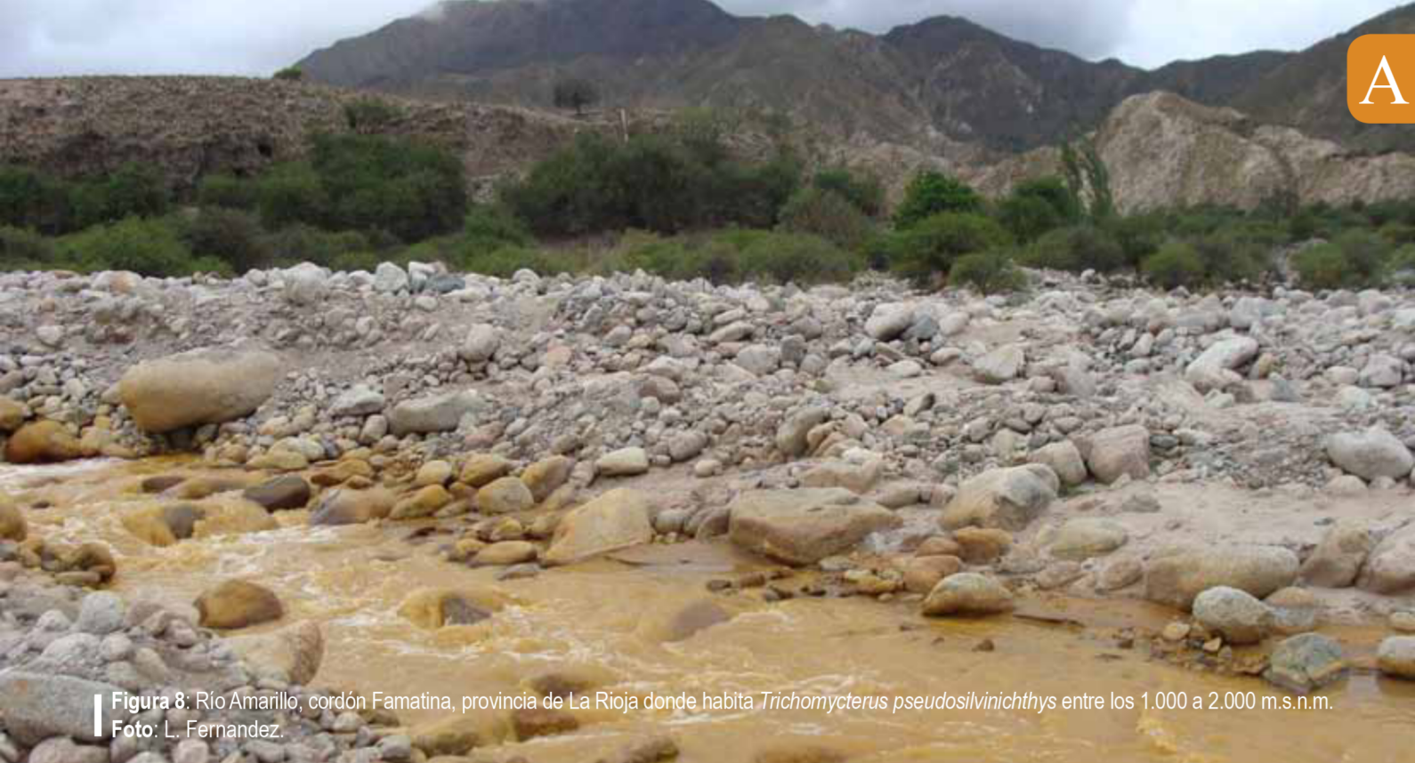
Figura 8: Río Amarillo, cordón Famatina, provincia de La Rioja donde habita Trichomycterus pseudosilvinichthys entre los 1.000 a 2.000 m.s.n.m.