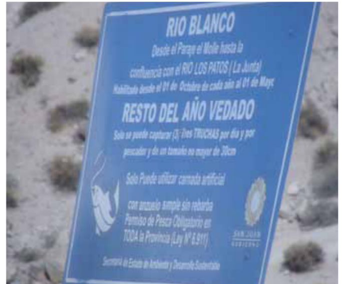
Figura 12: Carteles de protección de la trucha arco iris en la Cordillera: "Habilitado desde el 01 de Octubre de cada año al 01 de Mayo. Resto del año vedado. Solo se puede capturar (3) Tres Truchas por día y por pescador y de un tamaño no mayor a 30 cm. Solo puede utilizar carnada artificial con anzuelo simple sin rebarba".

están tomando algunas medidas, como la erradicación de las truchas arco iris (Figura 11) con pesca eléctrica en el Parque Nacional Leoncito en San Juan, donde vive un bagre endémico ( Silvinichthys leoncitensis Figura 4). Pero en las provincias del NOA continúan las políticas de siembra y resiembra en arroyos de cordillera e incluso con mayor difusión de las medidas de protección (Figura 12). Ante la propagación de las truchas, a los bagres nativos de los Andes no le queda otra opción que subir y restringirse en el refugio de las vegas o nacientes de los ríos donde la profundidad del agua es un limitante para la competencia/predación de las truchas (Figura 13).