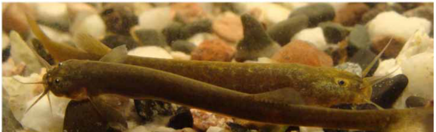
Figura 3: Bagre estigófilo Trichomycterus catamarcensis de la Reserva Biosfera Laguna Blanca 3.500 m.s.n.m, provincia de Catamarca.

En los Andes de Argentina el número de peces encontrados llega a 46 especies por encima de los 1.000 m de altura sobre el nivel del mar. Esta delimitación subjetiva (el límite de 1.000 m) ha sido seguida por diversos autores como Ortega (1992) y Schaefer (2011). La mayor riqueza corresponde a un grupo de bagres (Figura 3) pertenecientes a la familia Trichomycteridae (Orden Siluriformes) con 25 especies distribuidas en tres géneros ( Hatcheria , Silvinichthys y Trichomycterus ), de las cuales 9 corresponden a endemismos (Tabla 1) y de ellos 5 se definen como especies alto andinas (Tabla 1), esto es por encima de los 3.000 m de altura sobre el nivel del mar. En Argentina el mayor registro altitudinal conocido corresponde a Trichomycterus roigi de 4.800 m en la provincia de Jujuy. De los tres géneros de la subfamilia Trichomycterinae en Argentina, los Silvinichthys (Figura 4) son los únicos exclusivamente andinos, entre los 1.000 y 3.000 m de altura. Ocupan a veces ambientes de escasa profundidad (no mayores a 2 cm) como en el Parque Nacional Leoncito en San Juan, o bien en aguas subterráneas como en el río Arenales de Salta (Figura 5) o aguas termales en Los Nacimientos, Catamarca. Es importante destacar que en la Puna Argentina, hasta el momento, no fueron registrados ejemplares de Astrolepidae (Siluriformes), ni del género Orestias (Cyprinodontiformes) como ocurre en ambientes similares del Altiplano de Chile, Bolivia o Perú.