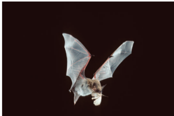
Figura 3. Un solo murciélago insectívoro puede consumir hasta 500 mosquitos en una noche lo cual hace de ellos muy buenos reguladores biológicos de estos insectos. En la foto un Murcielaguito de Yuma ( Myotis yumanensis ) capturando una polilla.

Los mitos y el desconocimiento también emergen como una amenaza más. Los problemas de convivencia en casas y edificios donde estos animales se albergan han llevado a grandes matanzas. Aunque numerosas organizaciones internacionales se dedican a la conservación de los murciélagos, por ejemplo, Bat Conservation International ( www.batcon.org ), Bat Conservation Trust ( www.bats.org.uk ). En América Latina hay numerosas entidades que también se dedican a su conservación y que están agrupadas dentro de la Red Latinoamericana para la Conservación de los Murciélagos (RELCOM - www.relcomlatinoamerica.net ). En Argentina, el Programa de Conservación de los Murciélagos de Argentina conocido como PCMA ayuda a conservar y promover la protección de los murciélagos. En su sitio web www.pcma.com.ar brinda acceso a información básica, útil y rigurosa para aquellos interesados en estos animales y proporciona sugerencias sobre acciones a tomar en caso de tener estos animales alojados en las casas sin dañarlos ni exponerse.