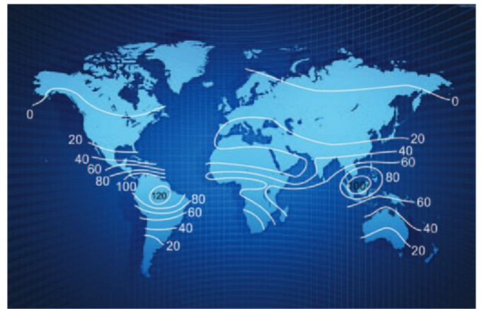
Figura 1. Variación del número de especies de murciélagos en el mundo (tomado de Altringham, 1996) que muestra claramente que el número de especies decrece con la latitud. Para hacer este mapa se tomaron cuadrantes de 500km 2 .

Para la mayor parte de la gente es difícil imaginar que animales tan pequeños y muchas veces despreciados como los murciélagos puedan tener importancia en los ecosistemas. Sin embargo, estos animales tienen características únicas que los colocan en una posición crucial en cuanto al funcionamiento de los bosques. En primer lugar, son los únicos mamíferos capaces de volar activamente gracias a una serie de características morfológicas, como las manos alargadas para soportar la membrana alar o patagio y adaptaciones sensoriales, como el sistema de radar (ecolocación) que emplean para orientarse en plena oscuridad. Estas características les han permitido alcanzar casi todos los biomas existentes en el planeta, desde densas e indómitas selvas hasta desiertos, ciudades e incluso lugares muy cercanos a los círculos polares. En segundo lugar, a lo largo de más de 60 millones de años de existencia en este planeta, han alcanzado una enorme diversidad tanto en número de especies como en variedad de formas (Simmons, 2005). Actualmente, se reconocen más de 1100 especies de murciélagos entre las que se encuentran representados casi todos los gremios tróficos (grupos de ani-