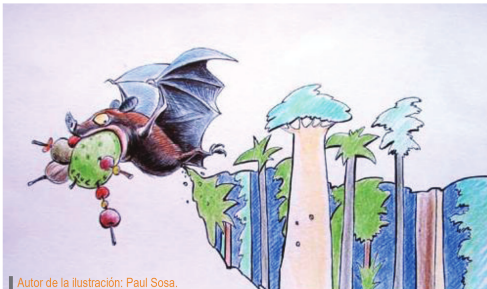
Autor de la ilustración: Paul Sosa.

Para concluir, por su elevada abundancia, diversidad y eficacia los murciélagos prestan numerosos servicios al ecosistema facilitando su renovación y existencia. Son considerados los mejores agentes de dispersión, polinizan una gran cantidad de plantas tanto en bosques como en regiones desérticas, controlan y mantienen el equilibrio en poblaciones de insectos regulando la herbivoría no sólo en los bosques sino en cultivos de los cuales dependemos. Todo esto aporta de manera significativa al flujo de la energía en los ecosistemas. Por estos motivos es que, en un mundo donde humanos y murciélagos interactúan, deben desarrollarse acciones y medidas que optimicen la convivencia para lograr un equilibrio en el ecosistema del cual todos somos parte.