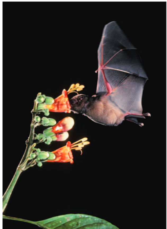
Figura 2. Murciélago nectarívoro ( Glossophaga soricina ) suspendido en el aire mientras se alimenta de néctar de una flor de Tricanthera.

poran además otros alimentos. Estas especies muestran todo un abanico de adaptaciones morfológicas como hocicos alargados, dientes reducidos, lenguas largas, pelo denso que almacena polen y características fisiológicas y comportamentales especiales (Kunz y Fenton, 2005). Hay al menos 750 especies de plantas que son visitadas por murciélagos (Fleming et al., 2009). En este caso, la interacción planta-animal resulta más intensa todavía ya que estas plantas dependen más aún de sus visitantes. Una situación particular se denomina "quiropterogamia": las flores muestran características morfológicas y funcionales que las relacionan fuertemente con los murciélagos, por ejemplo una estructura robusta, forma acampanada, colores blancos a crema, gran producción de polen y néctar, olor fuerte y apertura nocturna. Esta última característica implica que solamente son polinizadas de noche ya sea por insectos o por murciélagos.