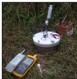
Figura N° 1: Cámara estática.

Teniendo en cuenta que las estimaciones de flujos mejoran al tomar mayor cantidad de muestras a expensas de un menor número de cámaras (Levy et al., 2011): se utilizaron 3 cámaras por punto de muestreo (parcela de 100 m 2 ), tomando en cada cámara 5 muestras de gases (colectadas en jeringas de 20 ml) en intervalos de tiempo de 10 minutos (0, 10, 20, 30, 40). Posteriormente las muestras de gases fueron conservadas en viales de 12 ml hasta su posterior análisis en laboratorio del Centro de Investigaciones en Física e Ingeniería del Centro de la Provincia de Buenos Aires-Tandil (Argentina).